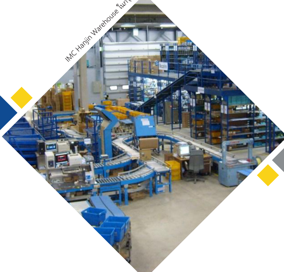
IMC Hanjin Warehouse ในกรุงโซล

การทำธุรกรรมกับรัสเซีย จากผลของโครงการคว่ำบาตรทางเศรษฐกิจของสหรัฐฯ ในวงกว้างที่กำหนดเป้าหมายไปยังรัสเซีย ห้ามส่งออก ส่งออกต่อ ขาย หรือจัดหาให้แก่ลูกค้าที่อยู่ในรัสเซียสินค้าซอฟต์แวร์หรือเทคโนโลยี/ข้อมูลทางเทคนิคที่มีแหล่งกำเนิดในสหรัฐฯ (เรียกรวมกันว่า "รายการ") ที่อยู่ภายใต้กฎหมายและระเบียบควบคุมการส่งออกของสหรัฐฯ (เรียกรวมกันว่า "สินค้าที่มาจากสหรัฐฯ") ไม่ว่าจะโดยตรงหรือโดยอ้อม (รวมถึงผ่านผู้จัดจำหน่าย ตัวแทนขาย หรือตัวกลางบุคคลที่สามหรือผู้ร่วมธุรกิจไม่ว่าจะอยู่ที่ใด) หากท่านพบเห็นว่า ธุรกรรมกับรัสเซียอาจเกี่ยวข้องกับสินค้าจากสหรัฐฯ จะต้องแจ้งเจ้าหน้าที่การปฏิบัติตามกฎระเบียบของ IMC ทันที และไม่ดำเนินธุรกรรมหากมิได้รับการอนุมัติล่วงหน้า