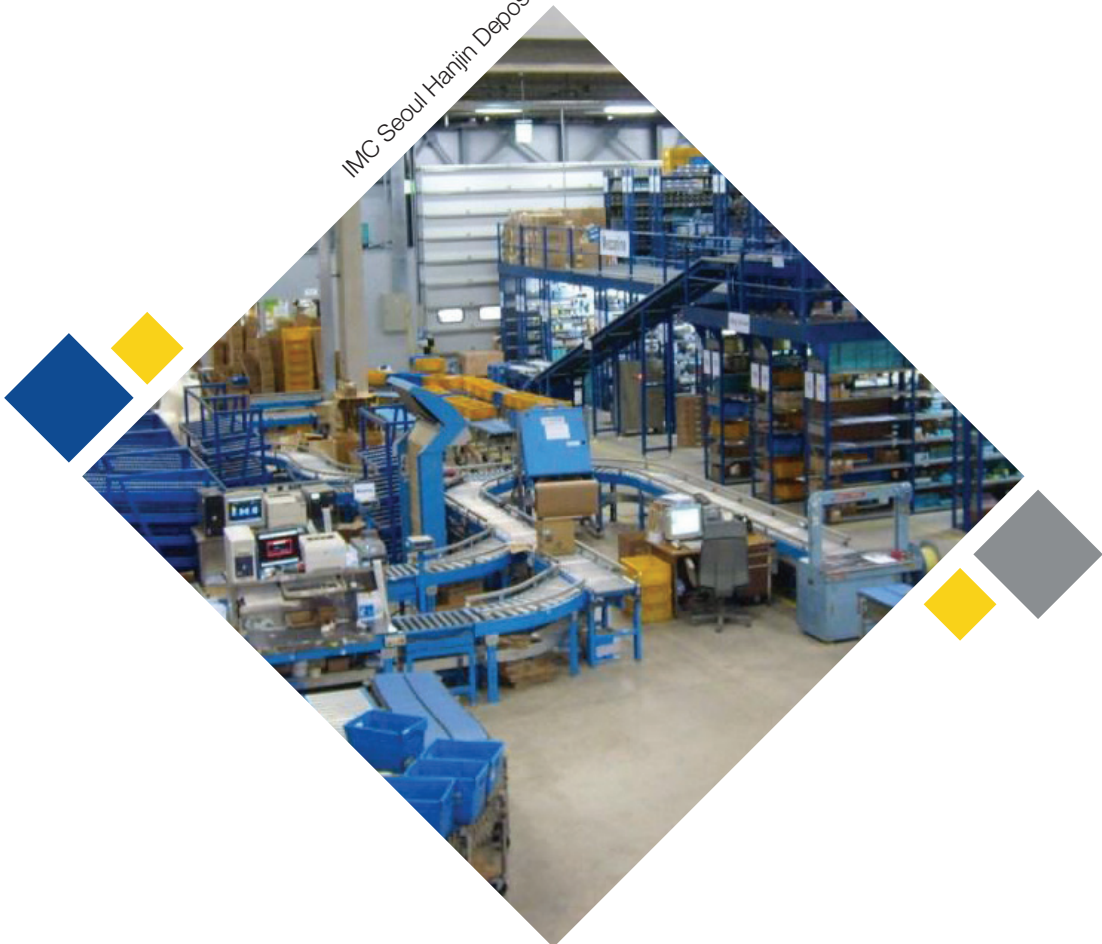
IMC Seoul Hanjin Deposu

Rusya ile yapılan bir işlemin Birleşik Devletler öğelerini içerebileceğini düşünüyorsanız, IMC Uyum Görevlisine derhal bilgi verilmeli ve işlem onun ön onayı olmadan devam etmemelidir.